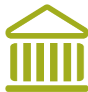
Kunst & cultuur