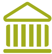
Kunst & cultuur