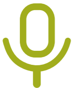
Media & communicatie